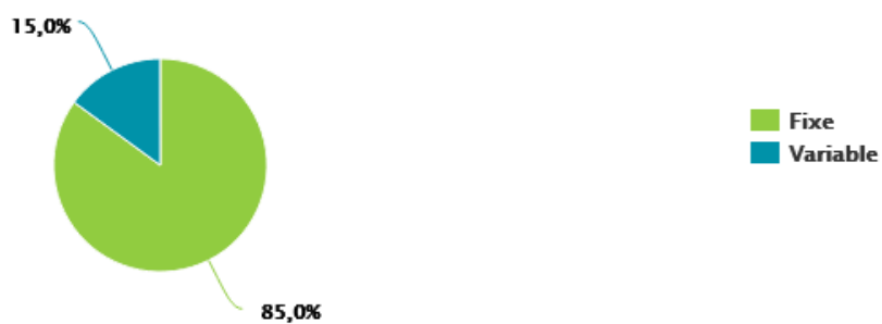
Dette par type de risque